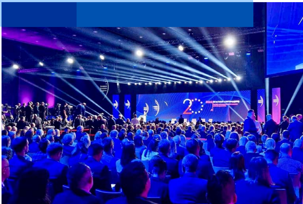
Europejski Kongres Gospodarczy w Katowicach

Swoją standardową aktywność w maju PARP wzbogaciła o udział w konferencjach, spotkaniach, warsztatach i szkoleniach. Nie zabrakło imprez promujących fundusze unijne. To m.in. organizowane od ponad 10 lat Dni