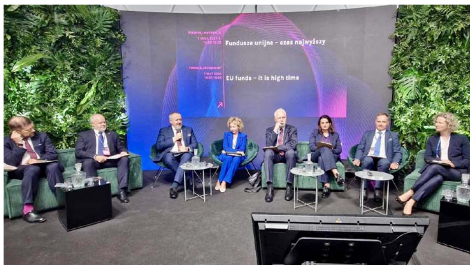
Debata „Fundusze unijne – czas najwyższy” na EKG w Katowicach

Na XVI Europejskim Kongresie Gospodarczym (EKG) w Katowicach (7-9 maja) eksperci rozmawiali o roli funduszy unijnych w transformacji sektora energii i całej gospodarki. W debacie „Fundusze unijne – czas najwyższy” przedstawiciele PARP uczestniczyli wspólnie z minister funduszy i polityki regionalnej Katarzyną Pełczyńską-Nałęcz. Na stoisku Polskiej Agencji Rozwoju Przedsiębiorczości eksperci przybliżali dostępne programy krajowe i możliwości, które stoją przed m.in. firmami, ośrodkami innowacji, klastrami i samorządami. Rozmawialiśmy też z przedstawicielami firm, które z sukcesem wykorzystały dotacje unijne. W drugim dniu EKG na stoisku PARP zaproszeni goście dyskutowali o polskiej